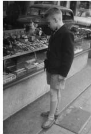
"On jouit moins de tout ce qu'on obtient que de ce qu'on espère" (J.-J. Rousseau)